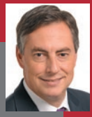
David McAllister MdEP Vorsitzender des Ausschusses für auswärtige Angelegenheiten